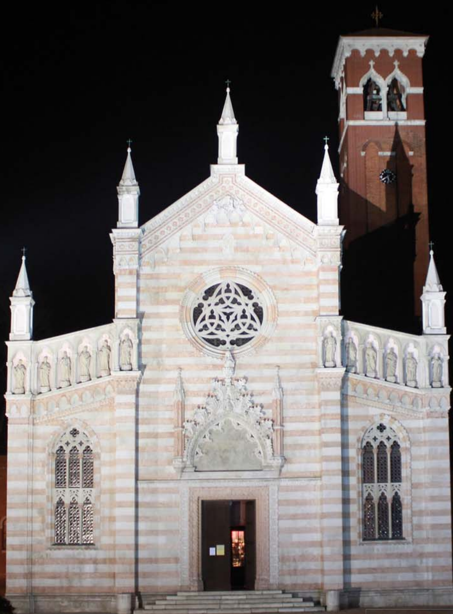
Kostel Panny Marie