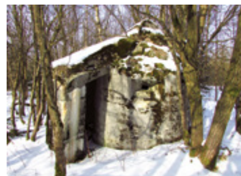
Druhý cínovecký einmannbunker