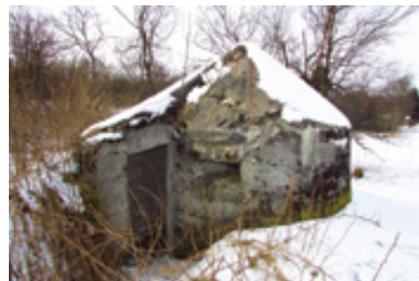
Einmannbunker v areálu bývalých rudných dolů