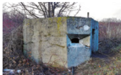
Betonový objekt u Novosedlic