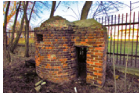
Cihlový einmannbunker v Pozorce