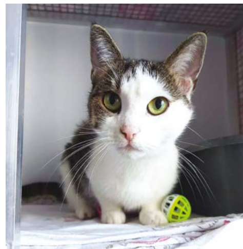
Děkujeme, že pomáháte spolu s námi.

Do roku 2026 vstupujeme s pokorou, ale i s odhodláním pokračovat dál. Opuštěných a týraných koček bohužel neubývá, ale s vaší pomocí jim můžeme i nadále dávat naději.