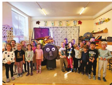
Kolektiv MŠ U Křemílka