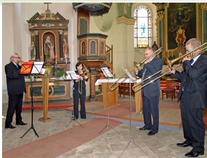
Koncert Trombónového kvarteta Konzervatoře Teplice