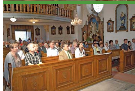
Součástí Slavnosti hraničního buku byla i společná česko – německá mše