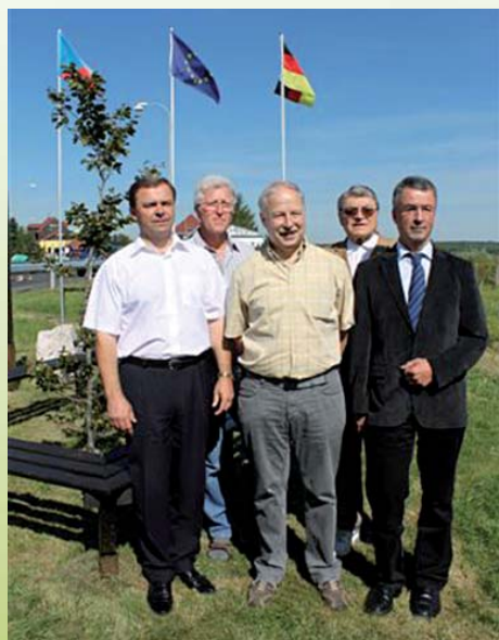
Setkání u „hraničního buku“