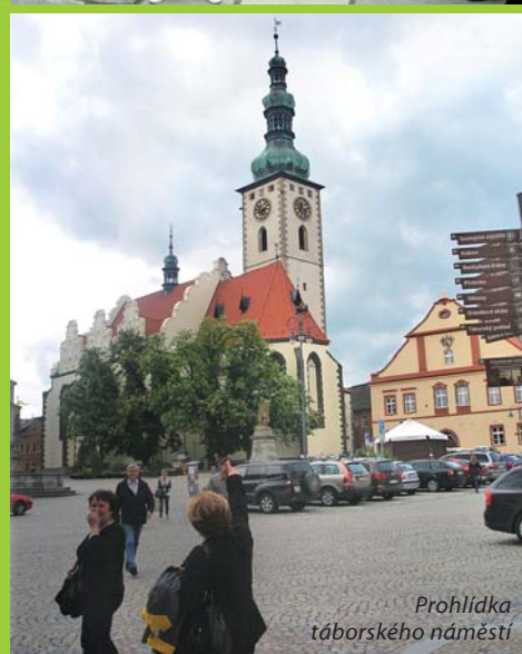
Prohlídka tábořského náměstí