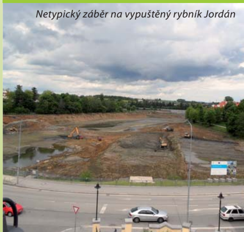
Netypický záběr na vypuštěný rybník Jordán