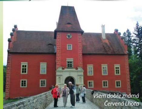
Všem dobře známá Červená Lhota