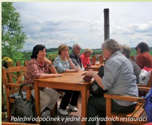
Polední odpočinek v jedné ze zahradních restaurací