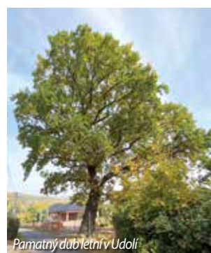
Památný dub letní v Udolí