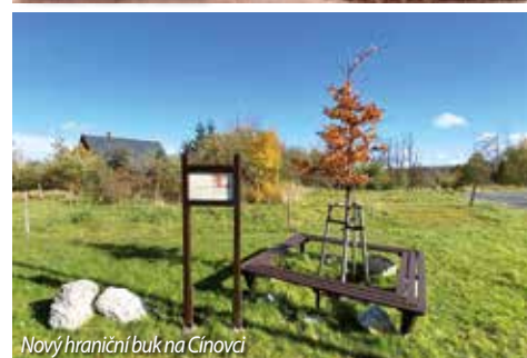
Nový hraniční buk na Cínovci

Zapomenout bychom neměli ani na státem chráněné památné stromy. Ty bychom dnes našli v Dubí na třech lokalitách. Již v roce 1995 byly pro svou výjimečnost za památné stromy prohlášené dvě lípy srdčité u kaple sv. Huberta ve Mstišově, v roce 2015 došlo k vyhlášení dubu letního o výšce 12 metrů a obvodu kmene 336 cm, který roste u ulice Školní ve Mstišově a dub letní v ulici Údolí o výšce 14 metrů a obvodu kmene 394 cm byl památným vyhlášen 2017. Na památný strom aspiruje i mohutný buk u polní cesty nad kostelem Nanebevzetí Panny Marie na Cínovci, který se podobá tomu Hraničnímu. Dalším kandidátem je i buk zvaný Rondellbuche, který se objevuje i na starých mapách a díky nedaleké knížecí myslivně Barvě se mu také říká Knížecí buk.