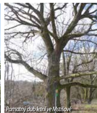
Památný dub letní ve Mstišově