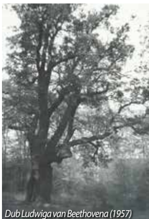
Dub Ludwiga van Beethovena (1957)

Zapomenout bychom neměli ani na státem chráněné památné stromy. Ty bychom dnes našli v Dubí na třech lokalitách. Již v roce 1995 byly pro svou výjimečnost za památné stromy prohlášené dvě lípy srdčité u kaple sv. Huberta ve Mstišově, v roce 2015 došlo k vyhlášení dubu letního o výšce 12 metrů a obvodu kmene 336 cm, který roste u ulice Školní ve Mstišově a dub letní v ulici Údolí o výšce 14 metrů a obvodu kmene 394 cm byl památným vyhlášen 2017. Na památný strom aspiruje i mohutný buk u polní cesty nad kostelem Nanebevzetí Panny Marie na Cínovci, který se podobá tomu Hraničnímu. Dalším kandidátem je i buk zvaný Rondellbuche, který se objevuje i na starých mapách a díky nedaleké knížecí myslivně Barvě se mu také říká Knížecí buk.