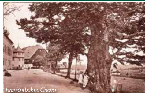
Hraniční buk na Cínovci

Občas okolo nich projdeme bez povšimnutí a přece jsou němými svědky, kteří svými korunami shlíží na své okolí desítky, ba stovky let. Řeč je o významných stromech, které se dostaly do pověstí, příběhů i na dobové pohlednice. Jedním z významných stromů byl dub Ludwiga van Beethovena nedaleko košťanského zámku, který dostal své jméno na počest návštěvy významného skladatele v nedaleké mstišovské oboře v roce 1811. Zda navštívil i samotný dub, není známo. Dle pověsti se na louce pod tímto stromem utábořilo rakouské vojsko táhnoucí do bitvy u Chlumce, která proběhla ve dnech 29.-30. srpna 1813. Samotný dub s obvodem 742 cm patřil mezi nejmohutnější a nejstarší duby v severozápadních Čechách. Život stromu ukončil 28. února 2012 zřejmě úmyslně vyvolaný požár, který pohltil dutinu kmene. V blízkosti zbytků kmene původního dubu byl 31. května 2017 vysazen dub červený, který symbolicky nese jméno Nový dub Ludvík. Samotné místo bylo upraveno a dnes nabízí posezení pro kolemjdoucí turisty.