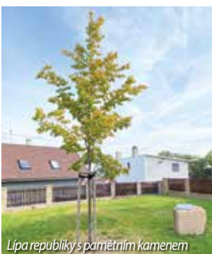
Lípa republiky s pamětním kamenem