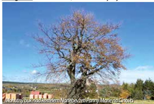
Mohutný buk nad kostelem Nanebevzetí Panny Marie na Cínovci