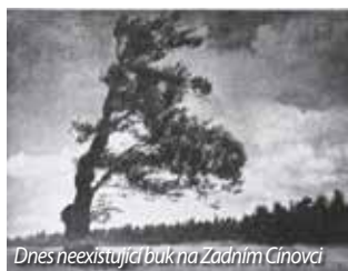
Dnes neexistující buk na Zadním Cínovci

Občas okolo nich projdeme bez povšimnutí a přece jsou němými svědky, kteří svými korunami shlíží na své okolí desítky, ba stovky let. Řeč je o významných stromech, které se dostaly do pověstí, příběhů i na dobové pohlednice. Jedním z významných stromů byl dub Ludwiga van Beethovena nedaleko košťanského zámku, který dostal své jméno na počest návštěvy významného skladatele v nedaleké mstišovské oboře v roce 1811. Zda navštívil i samotný dub, není známo. Dle pověsti se na louce pod tímto stromem utábořilo rakouské vojsko táhnoucí do bitvy u Chlumce, která proběhla ve dnech 29.-30. srpna 1813. Samotný dub s obvodem 742 cm patřil mezi nejmohutnější a nejstarší duby v severozápadních Čechách. Život stromu ukončil 28. února 2012 zřejmě úmyslně vyvolaný požár, který pohltil dutinu kmene. V blízkosti zbytků kmene původního dubu byl 31. května 2017 vysazen dub červený, který symbolicky nese jméno Nový dub Ludvík. Samotné místo bylo upraveno a dnes nabízí posezení pro kolemjdoucí turisty.