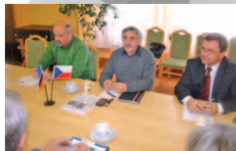
Dopravní komise Euroregionu Krušnohoří jednala v zasedací místnosti MěÚ Dubí.