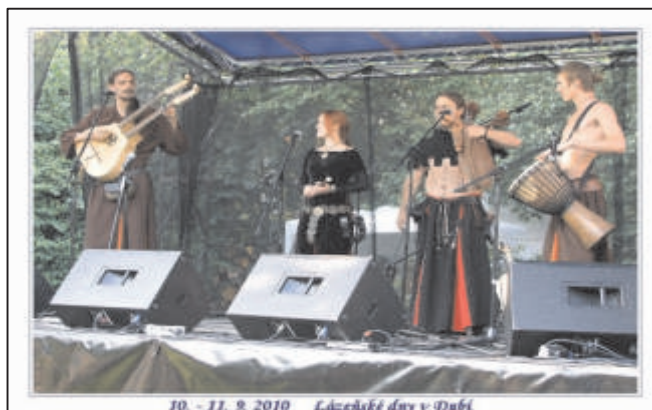
10. - 11. 9. 2010 Lázeňské dny v Dubí

U příspěvků delších než rozsah A4 si redakce vyhrazuje právo obsah bez porušení smyslu přiměřeně zkrátit.