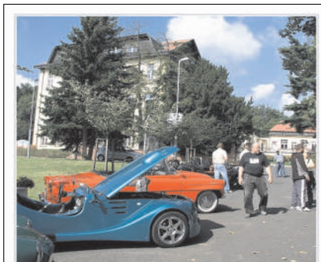
10. - 11. 9. 2010 Lázeňské dny v Dubí