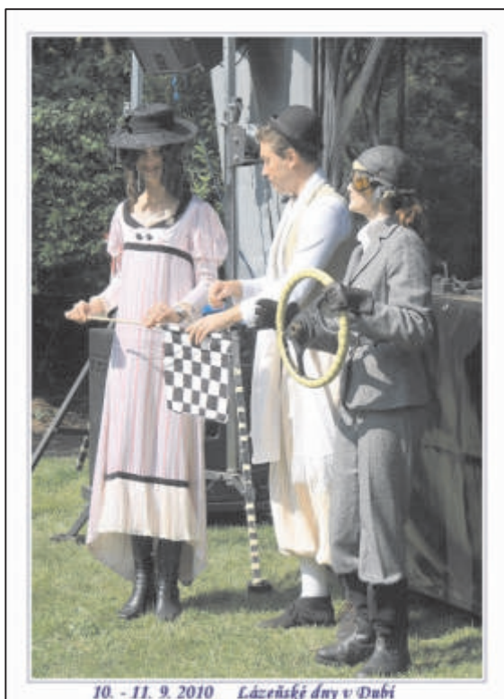
10. - 11. 9. 2010 Lázeňské dny v Dubí