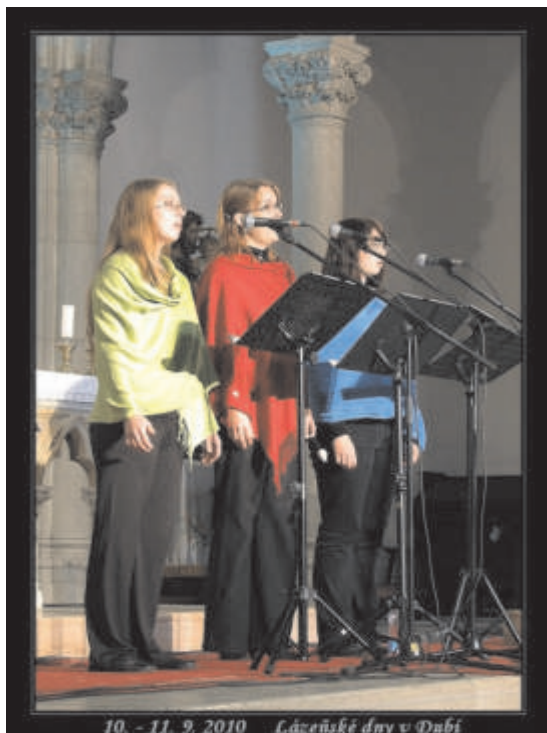
10. - 11. 9. 2010 Lázeňské dny v Dubí