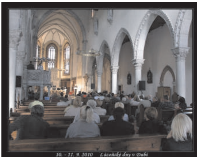
10. - 11. 9. 2010 Lázeňské dny v Dubí