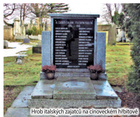
Hrob italských zajatců na cínoveckém hřbitově