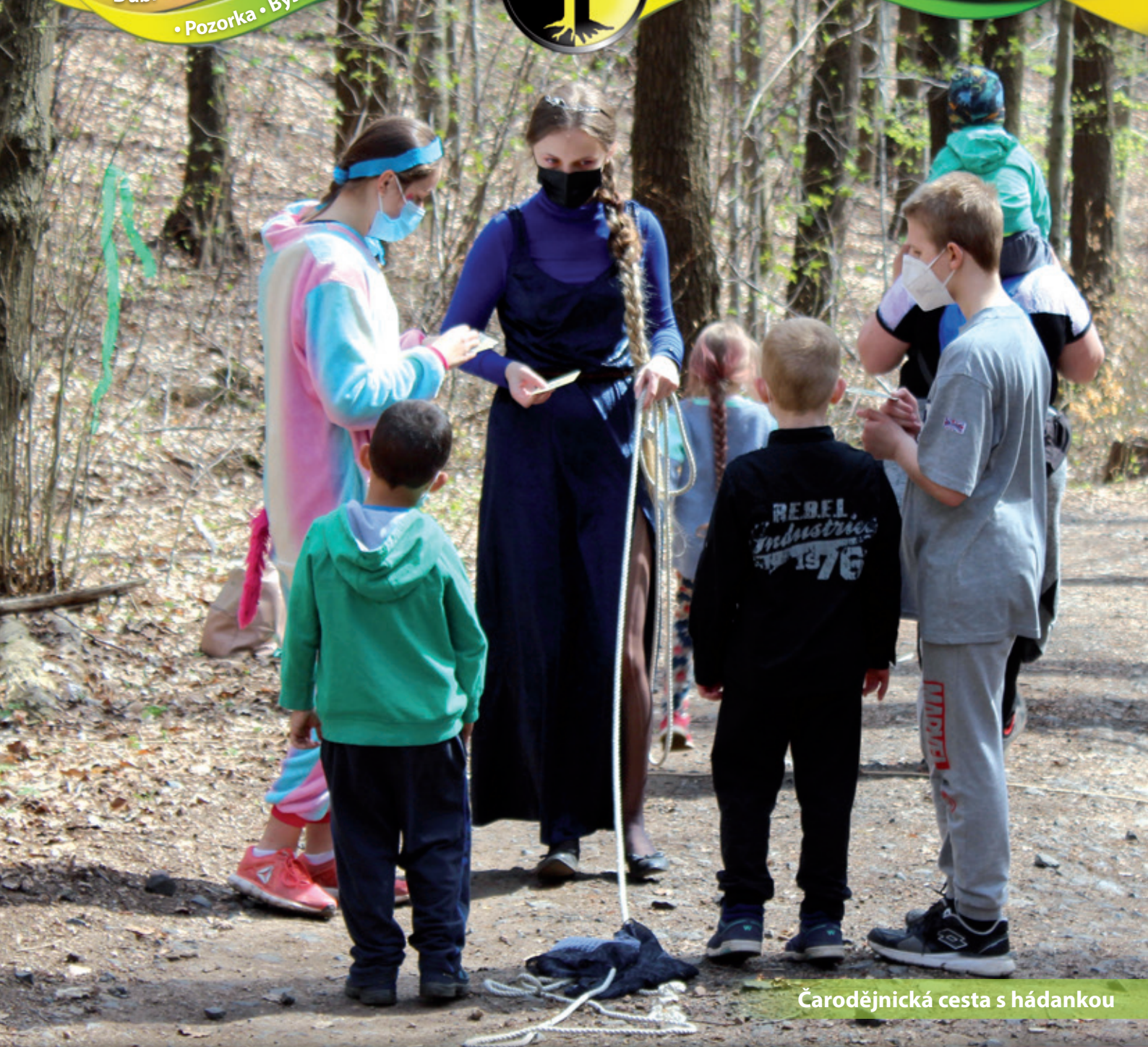
Čarodějnická cesta s hádankou