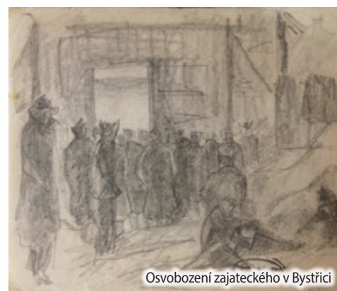
Osvobození zajateckého v Bystřici