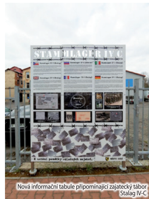
Nová informační tabule připomínající zajatecký tábor Stalag IV-C