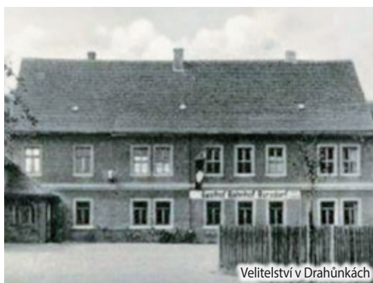
Velitelství v Drahnůvkách