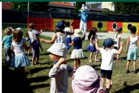
Kolektiv MŠ U Křemílka

Rok se s rokem sešel a v mateřince U Křemílka nastal opět čas loučení. Protože všichni naši školáčky už u zápisu prokázali, že jsou na velkou školu dobře připraveni, rozhodli jsme se tento den, který je ve školce věnovaný hlavně jim, pojmout netradičně a zahrát si tentokrát na indiány. Dopoledne tedy museli malí indiáni, pod dohledem „velkého náčelníka“, složit zkoušku ze znalostí indiánského života a zakončit ji společným oslavným tancem. Odpoledne už je i jejich rodiče a kamarády čekal bohatý program s mnoha překvapeními a pasováním na školáčky. Nechyběly soutěže, zpěv, tanec, ani dětské šampaňo. Prostě celý den byl opravdu prima a na tohle loučení budeme vzpomínat.