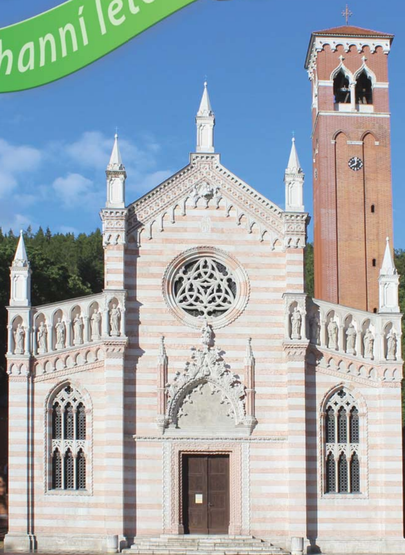
Kostel Panny Marie