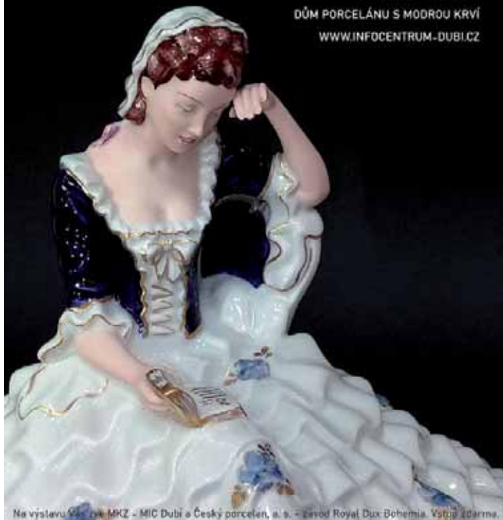
Na výstavu Vás zveme MKZ - MIC Dubí a Český porcelán, a.s. - závod Royal Dux Bohemia. Vstup zdarma.

Srdečně Vás zveme na výstavu figurálního porcelánu manufaktury Royal Dux Bohemia v Duchcově, která proběhne od 3. do 17. září 2020 v Domě porcelánu s modrou krví v Dubí.