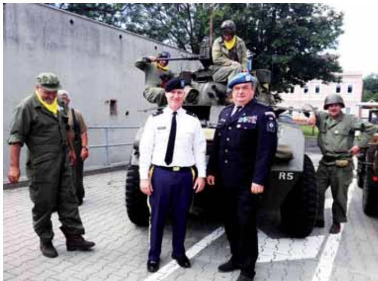
Pozn. - na fotografii č.02 je armádní atašé Velvyslanectví USA plk. Roger Bowman