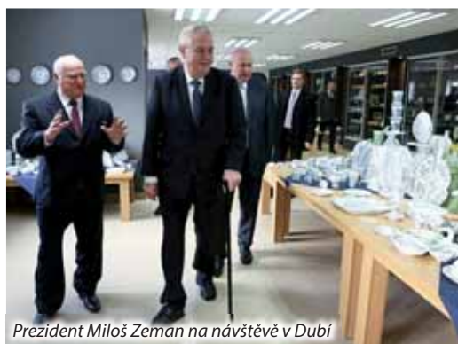
Prezident Miloš Zeman na návštěvě v Dubí