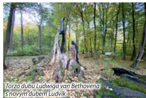
Torzo dubu Ludwiga van Bethovena s novým dubem Ludvík