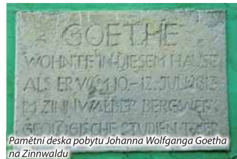
Pamětní deska pobytu Johanna Wolfganga Goetha na Zinnwaldu