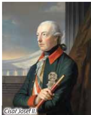
Císař Josef II.

Dubí během své historie nemohlo nikdy konkurovat slavnějšímu lázeňskému městu Teplice, kam se sjížděli panovníci, šlechta, umělci a diplomaté. Přesto Dubí navštívilo několik významných návštěvníků. Prvním významným návštěvníkem byl rakouský císař Josef II., který sem zavítal při cestách do Krušnohoří v letech 1766 a 1799. Přesuňme se na začátek 19. století, kdy se Dubí a okolí stalo významným turistickým cílem teplických lázeňských hostů. Roku 1811 navštívil oboru ve Mstišově skladatel a klavírista Ludwig van Beethoven. Na připomínku této návštěvy byl později pojmenován mohutný dub nedaleko košťanského zámku jako dub Ludwiga van Beethovena nebo zkráceně Ludvíkův dub. Hned několikrát se v Dubí zastavil básník, prozaik, dramatik, přírodovědec a politik Johann Wolfgang Goethe. Poprvé se tak stalo 10. června 1812 a následně ještě dvakrát 15. května