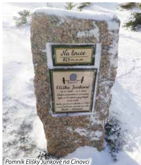
Pomník Elišky Junkové na Cínovci