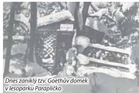
Dnes zaniklý tzv. Goethův domek v lesoparku Paraplíčko