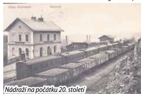
Nádraží na počátku 20. století