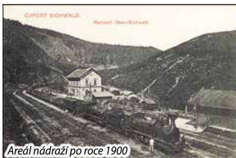
Areál nádraží po roce 1900