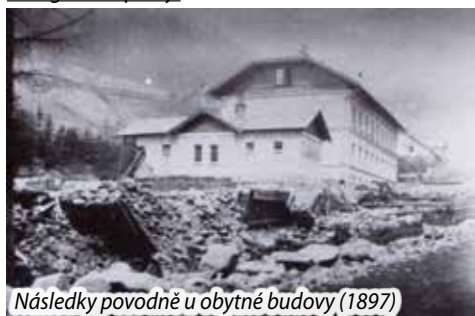
Následky povodně u obytné budovy (1897)