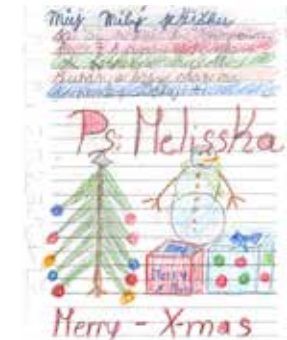
Přání Ježíškovi „utržené“ z vánočního stromu