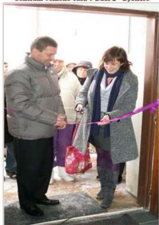
Slavnostní otevření 13. 12. 2010