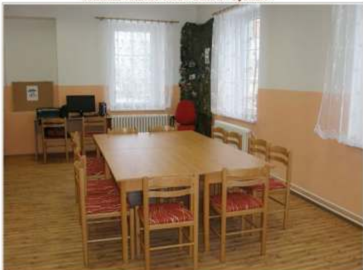
herna č. 1