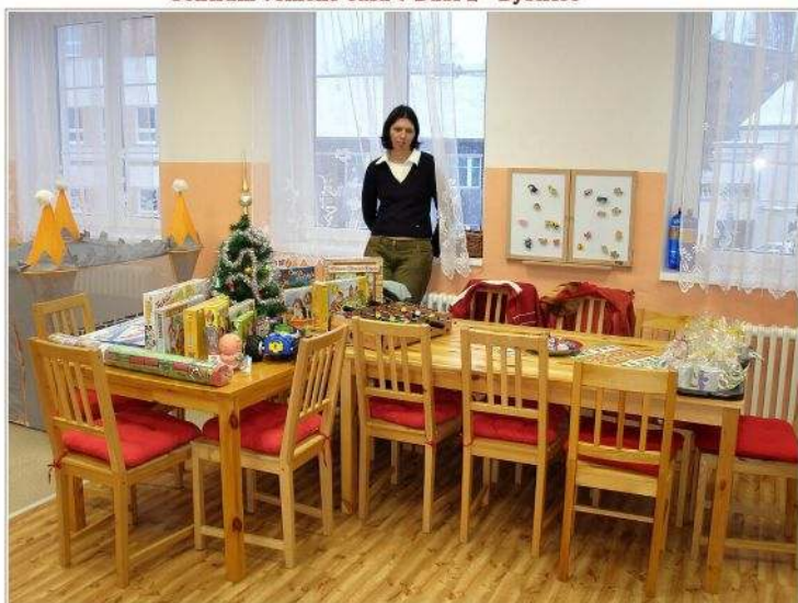
herna č. 3