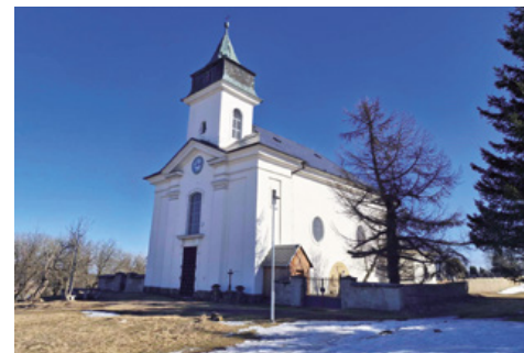
Foto po rekonstrukci na začátku roku 2025