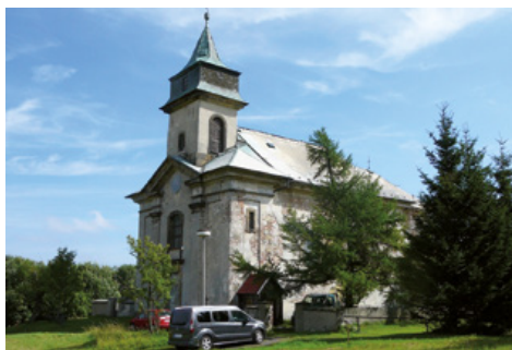
Foto před rekonstrukcí z roku 2017