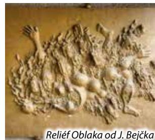
Reliéf Oblaka od J. Bejčka