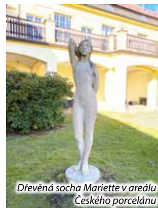
Dřevěná socha Mariette v areálu Českého porcelánu