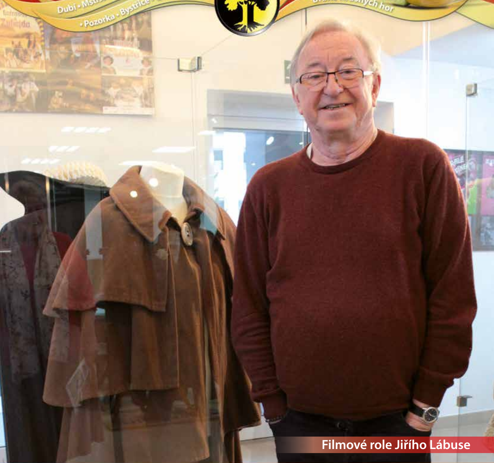
Filmové role Jiřího Lábus