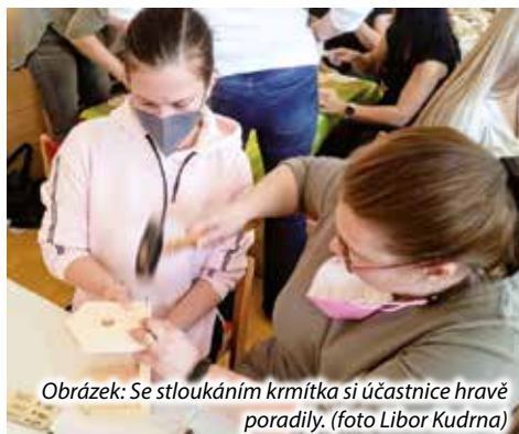
Obrázek: Se stloukáním krmítka si účastnice hravě poradily. (foto Libor Kudrna)