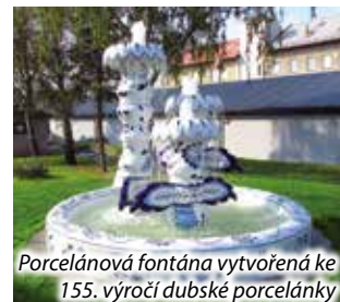
Porcelánová fontána vytvořená ke 155. výročí dubské porcelánky