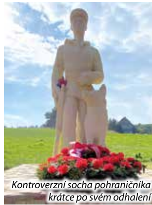
Kontroverzní socha pohraničníka krátce po svém odhalení