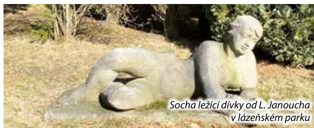
Socha ležící dívky od L. Janoucha v lázeňském parku