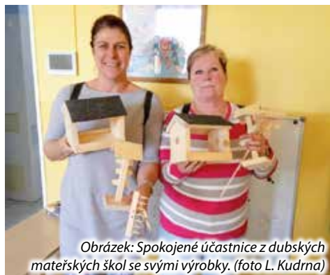
Obrázek: Spokojené účastnice z dubských mateřských škol se svými výrobky.