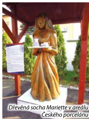
Dřevěná socha Mariette v areálu Českého porcelánu