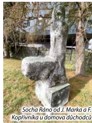
Socha Ráno od J. Marka a F. Koprivníka u domova důchodců